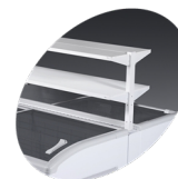
Tablettes promotionnelles en accessoire